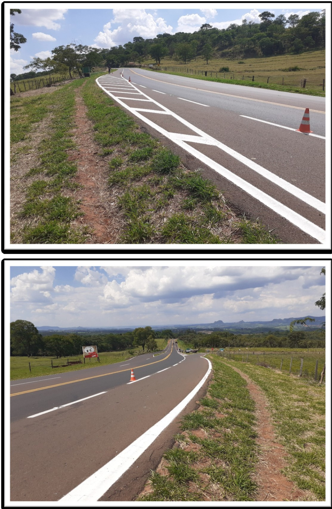
Figura 4: Pintura com tinta viária