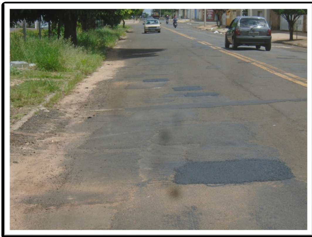
Figura 2: Remendo Asfáltico