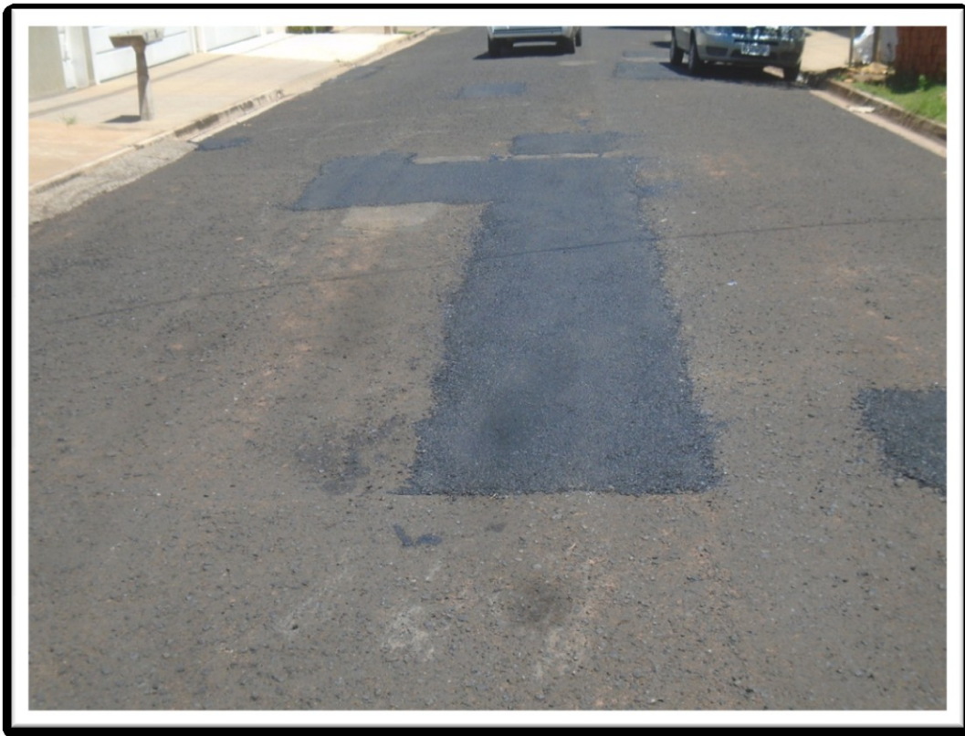
Figura 1: Remendo Asfáltico