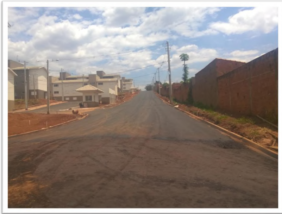
Figura 10 Pavimentação