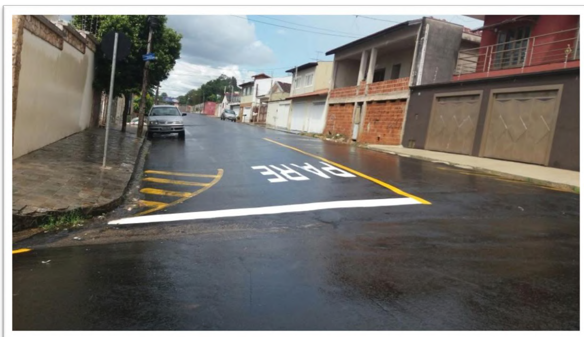
Figura 6: Pintura com tinta viária