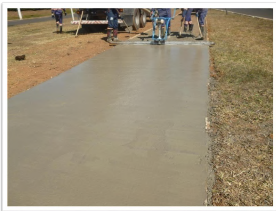
Figura 5: Passeio de Concreto