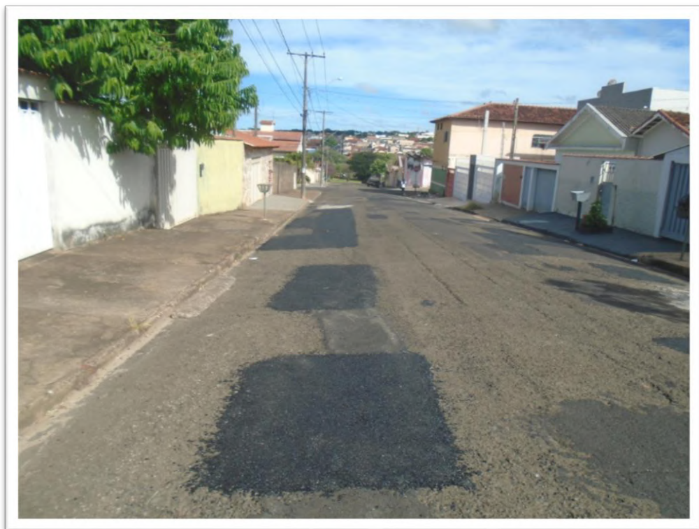
Figura 3: Remendo Asfáltico