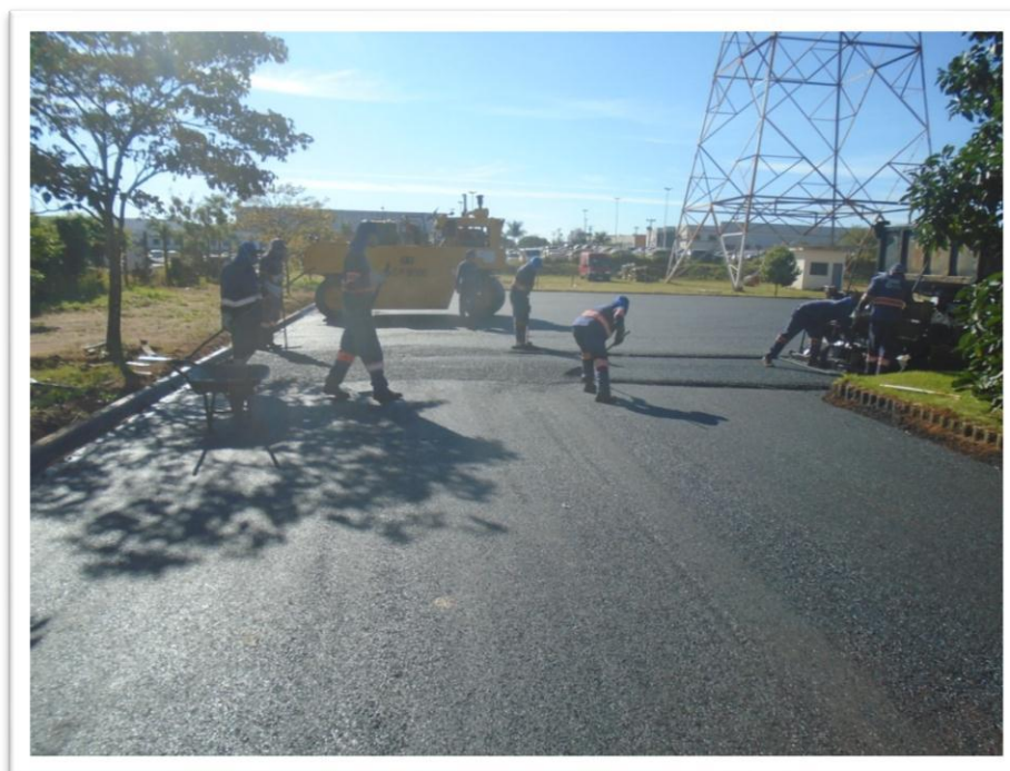
Figura 13 Pavimentação