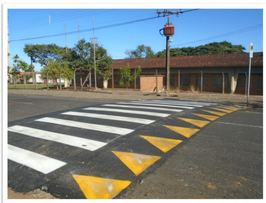
Figura 8: Execução de Lombofaixa