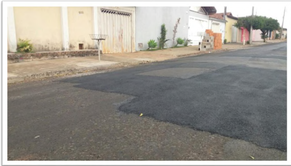
Figura 2: Remendo Asfáltico