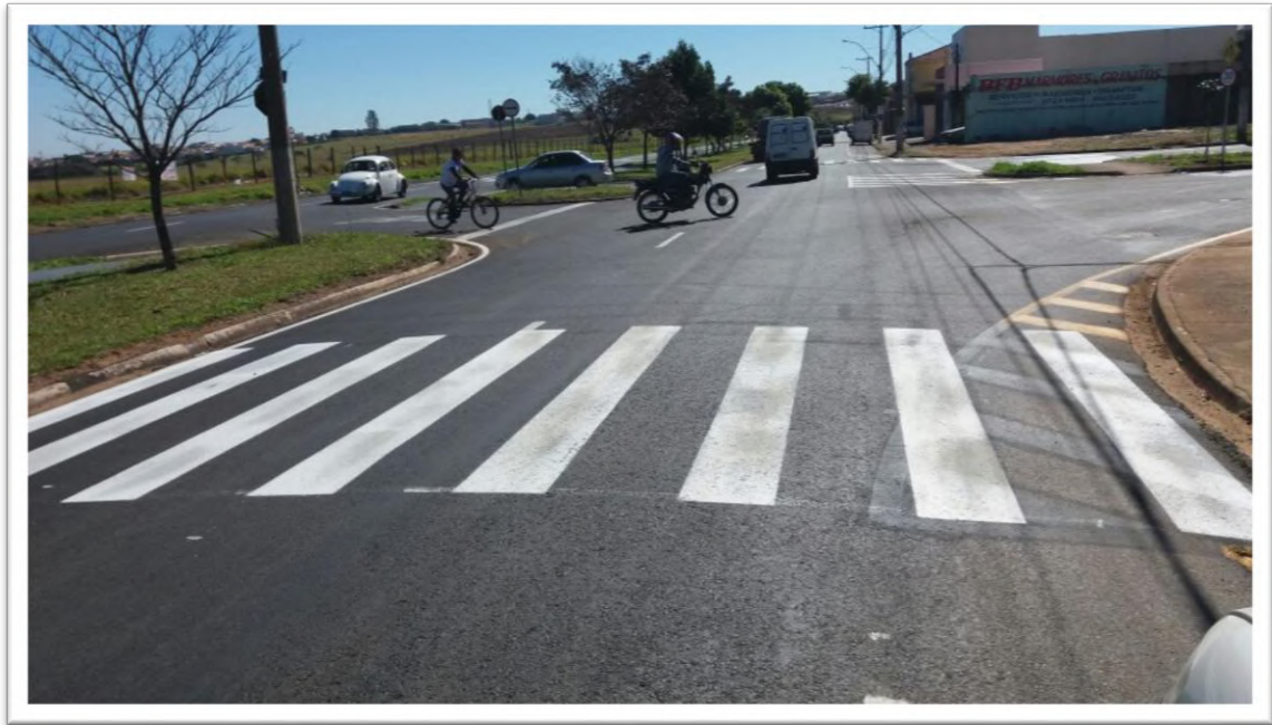
Figura 7: Pintura com tinta viária