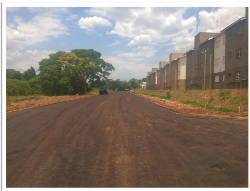
Figura 9 Pavimentação