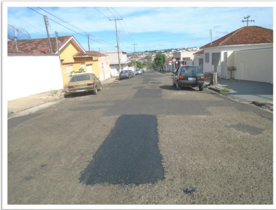
Figura 4: Remendo Asfáltico