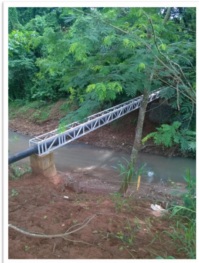
Figura 11 Execução da rede de água e esgoto