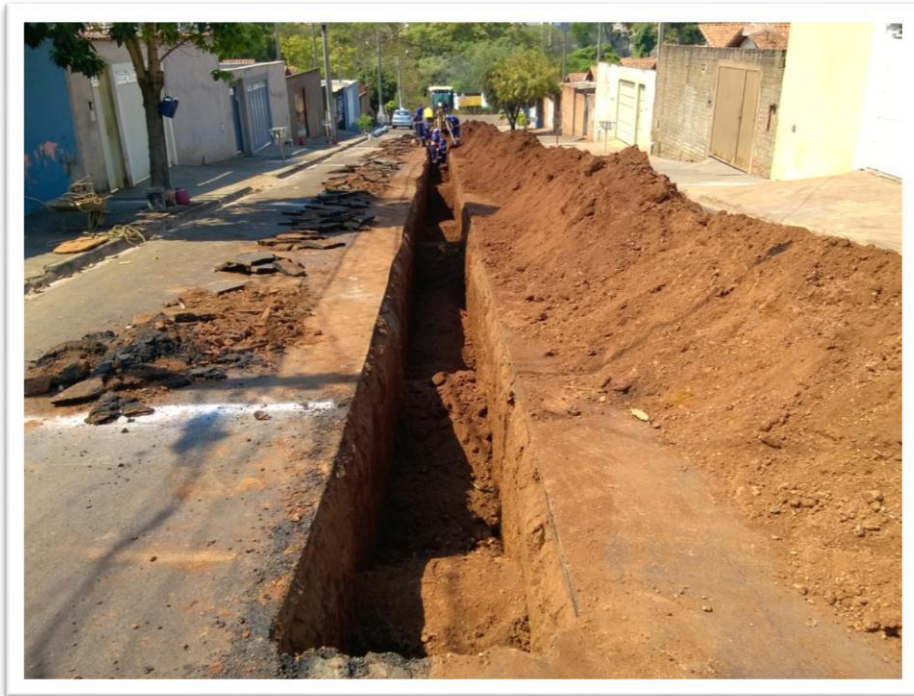
Figura 12 Execução rede de água e esgoto