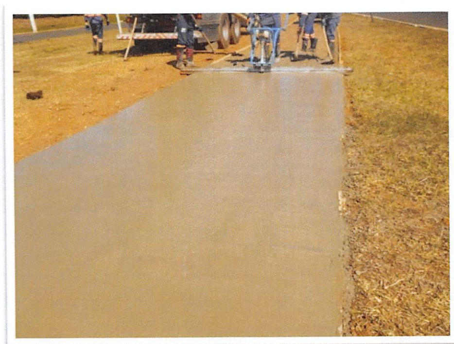
Figura 3: Passeio de Concreto