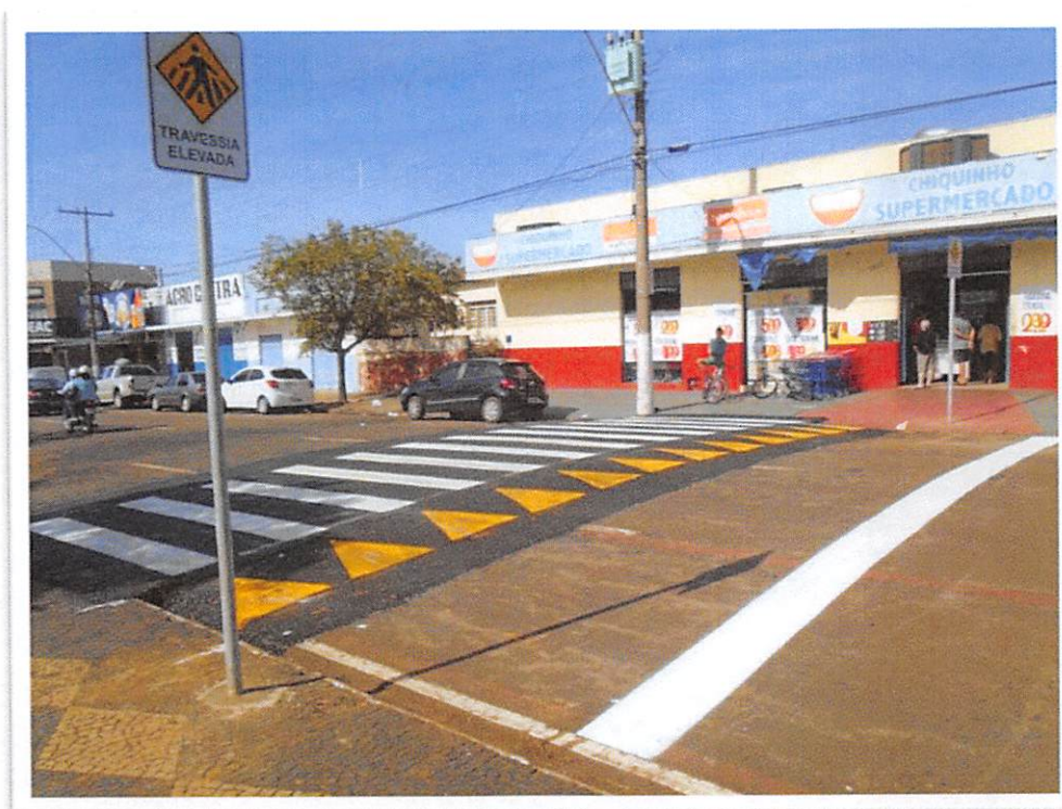
Figura 6: Execução de Lombofaixa