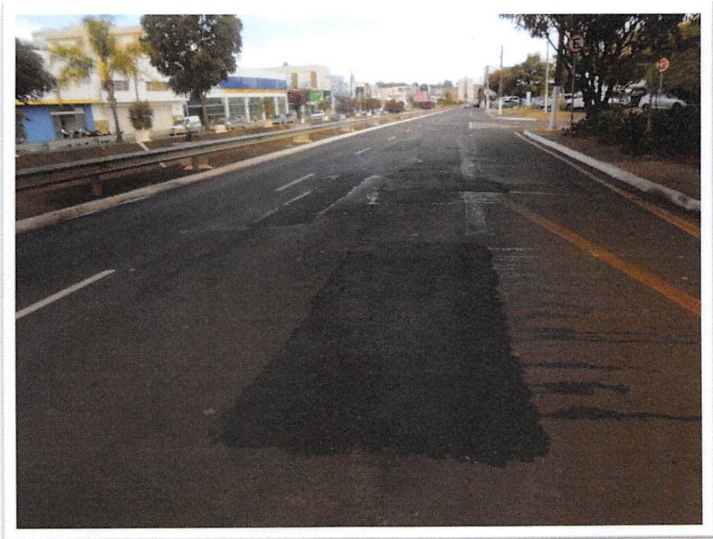
Figura 1: Remendo Asfáltico