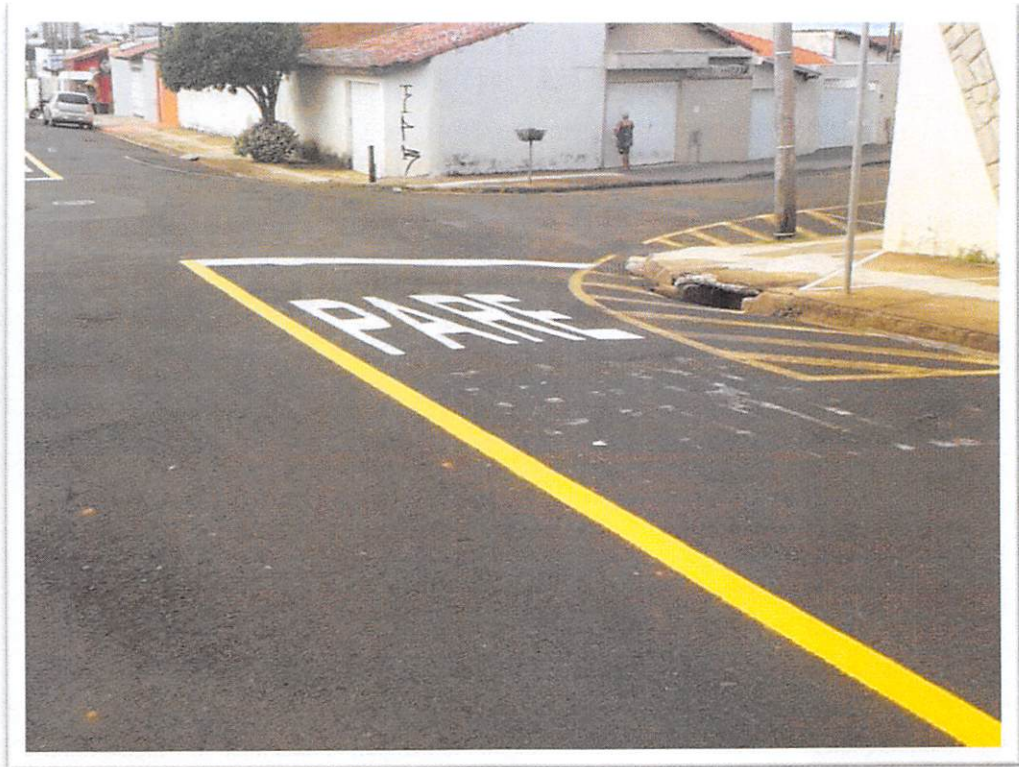
Figura5: Pintura com tinta viária