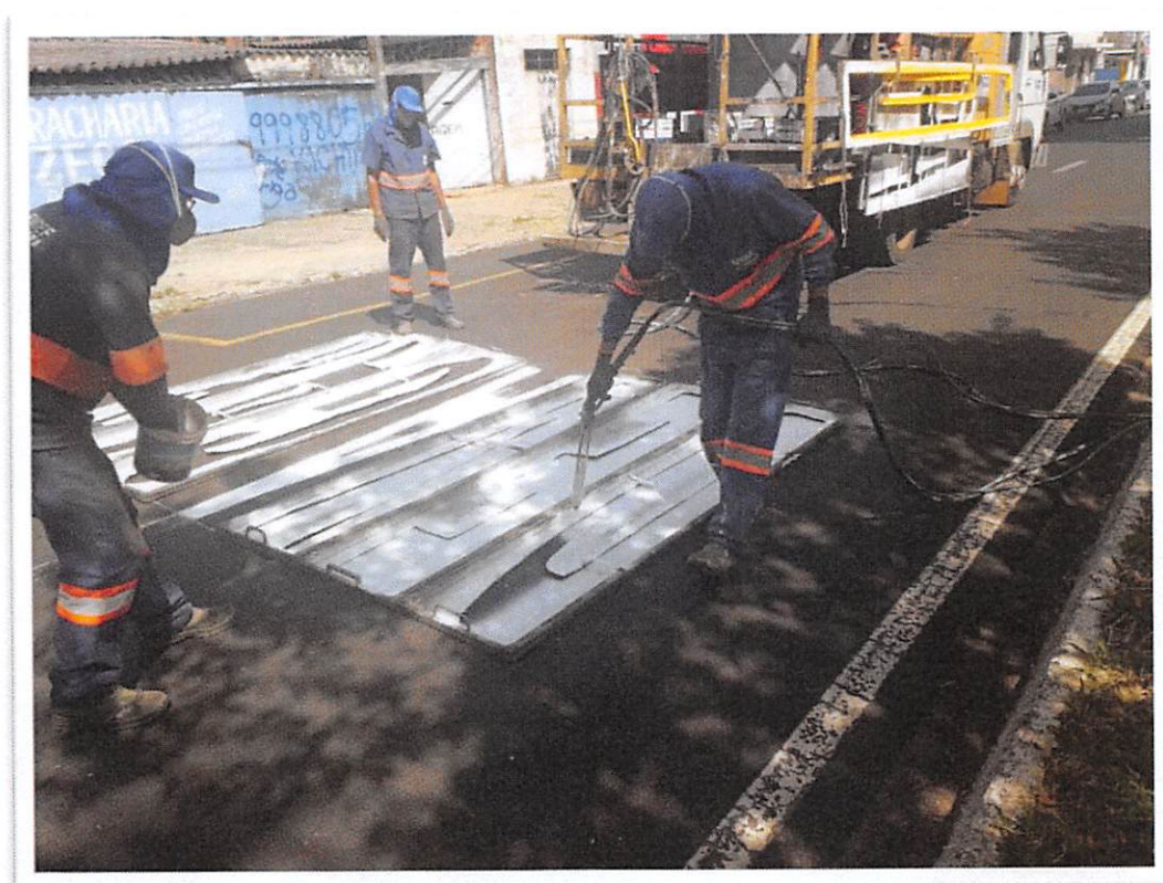
Figura 4: Pintura com tinta viária