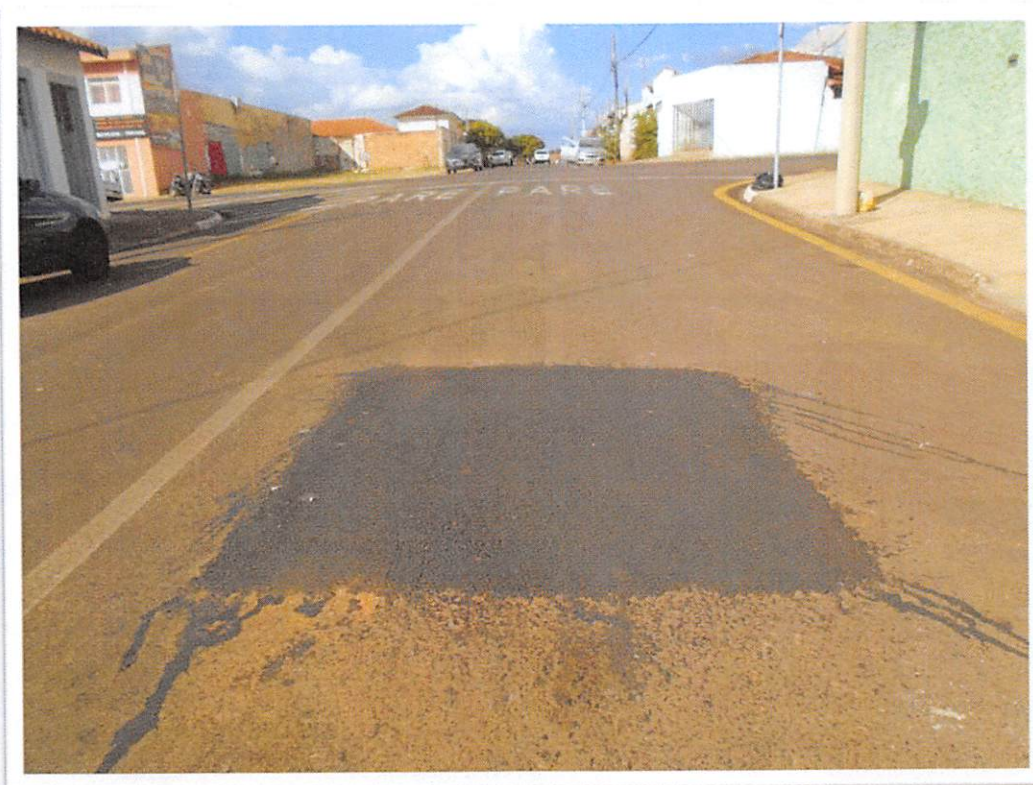
Figura 2: Remendo Asfáltico